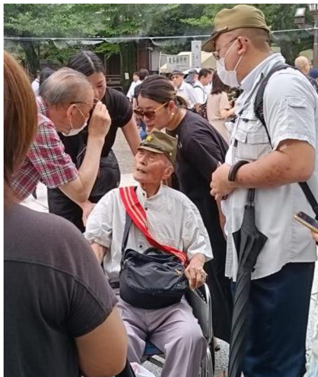
תמונה 4: סיפורי מלחמה בגוף ראשון 69

לאור מפגשים אלה, חשוב לראות את תפקידו של מקדש יסוקוני כמרחב שמאפשר לאנשים שחוו את המלחמה לזכור את עברם ולהתאבל עליו, מעבר להקשר הפוליטי שדבק בו ולסמליות שנלווית אליו. לצד המאמצים להתיר את הקשר הסבוך של המחלוקת סביב יסוקוני, חשוב גם לציין כי הנרטיב השמרני-לאומני שאגודות הימין דוחפות דרך יסוקוני והיושוקן מהווה פרשנות אחת של סקטור מסוים באוכלוסייה. זהו מרכיב במחלוקת שהמקדש מייצר. רבים ממתנגדיו מוחים על עירוב פוליטיקה בהנצחה, ועיצוב זיכרון ההיסטוריה בהתאם לאגינדה פוליטית.