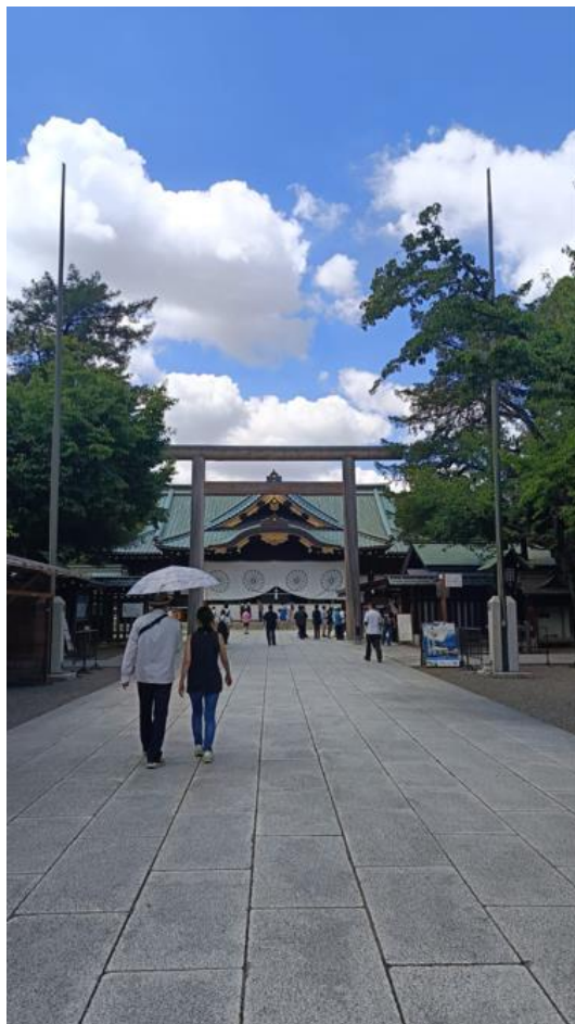
תמונה 1: צועדים בכניסה למקדש יסוקוני 1